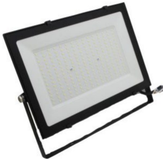
Таблиця 2.5 – Небезпечні та шкідливі фактори, заходи та засоби захисту

Прожектор LED 150W 6500K IP65 15000LM LEMANSO – потужність 150 Вт, світловий потік 15000 лм, ступінь захисту IP65, колірна температура 6500 К.