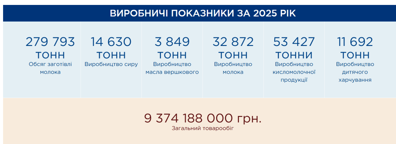
Рис.2.4 -Виробничі показники АТ «Молочний альянс»

Однією з ключових особливостей діяльності АТ «Молочний альянс» є орієнтація на якість продукції та відповідність міжнародним стандартам безпеки харчових продуктів. На підприємствах групи впроваджено сучасні системи контролю якості, зокрема стандарти HACCP та ISO. Контроль здійснюється як на етапі приймання сировини, так і безпосередньо під час виробничого процесу. Ключові виробничі показники підприємства наведені на рис. 2.4.